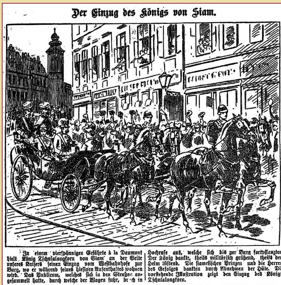
The Siamese King and Emperor Franz Joseph I in Vienna

Organized by the Royal Thai Embassy, Vienna On 11 September 2009 At the Natural History Museum Vienna