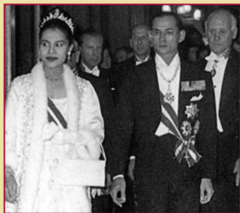
Their Majesties King Bhumibol Adulyadej and Queen Sirikit during the royal visit to Austria, October 1964.

On 5 October 1964, the Academy of Music and Performing Arts Vienna, now the University of Music and Performing Arts Vienna, which was established in 1817 and had then listed only 22 Honorary Members, presented the 23rd Honorary Membership to His Majesty the King in recognition of his jazz compositions and other musical achievements. The inscription of His Majesty's name "Bhumibol Adulyadej" was shown on the Academy's commemorative stone.