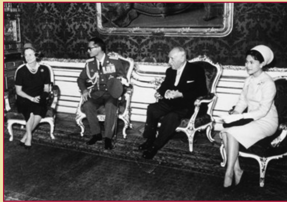
Their Majesties with the Federal President Adolf Schärf on 29 September 1964

Später verließen Ihre Majestäten Wien und nahmen einen Sonderzug nach Salzburg. Dieser Besuch Österreichs ist der Bevölkerung bis zum heutigen Tag in guter Erinnerung erhalten.