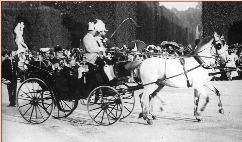
King Chulalongkorn and Emperor Franz Joseph I in the garden of Schönbrunn Palace on 24 June 1897

Upon departure, Emperor Francis Joseph I presented King Rama V with a Lipizzaner horse which was duly shipped to Siam.