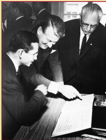
His Majesty with the Music Director at the Vienna Concert Hall on 3 October 1964

At the age of 37, His Majesty King Bhumibol Adulyadej of Thailand became the youngest member and the first Asian composer to have received this honour. Ever since, exchanges of visits have been carried out continuously at all levels and bilateral ties have been intensified, ranging from trade, investment, academic, scientific and cultural cooperation. In commemoration of a long and cordial relationship, the two countries celebrated the 55th anniversary of the establishment of diplomatic relations and the 140th anniversary of a long-standing relationship in 2008.